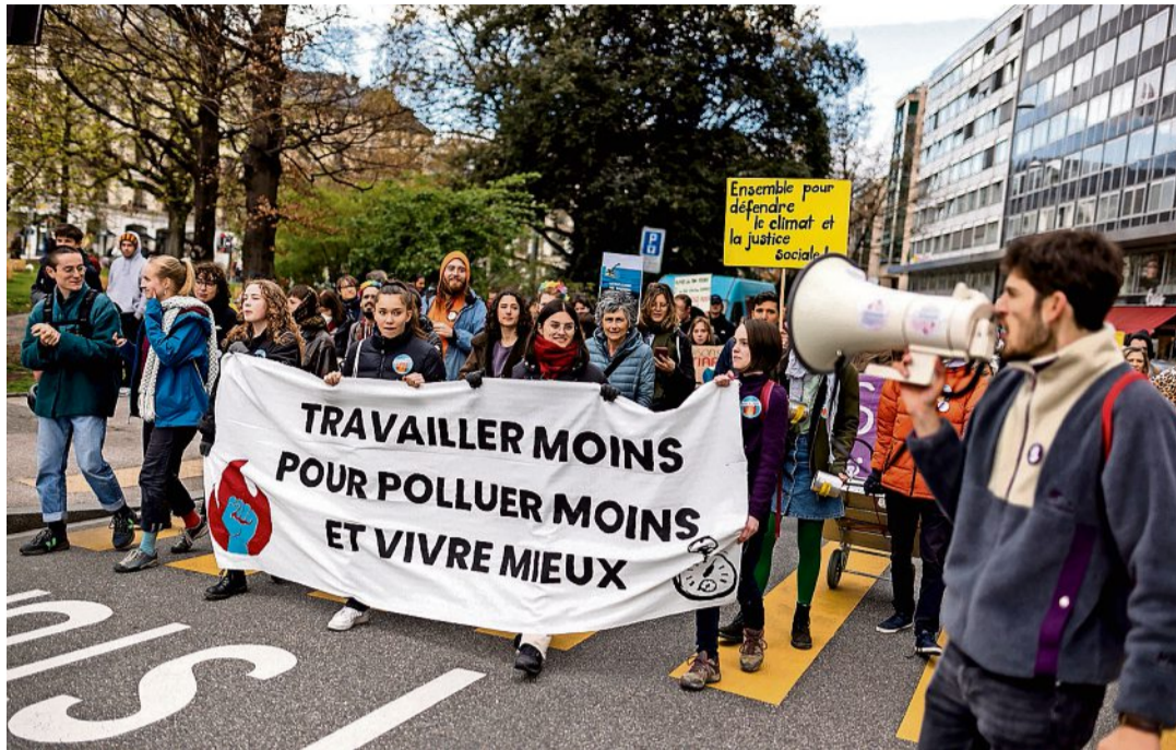
Le cortège de la Grève pour l'avenir est parti de la place Lise-Girardin et s'est dirigé vers la rotonde du Mont-Blanc. PIERRE ALBOUY

Alors que le cortège se dirige vers la rotonde du Mont-Blanc, certains profitent de l'occasion pour faire signer une initiative pour des TPG gratuits. Nath affiche son appartenance à Extinction Rebellion et indique être là pour se battre