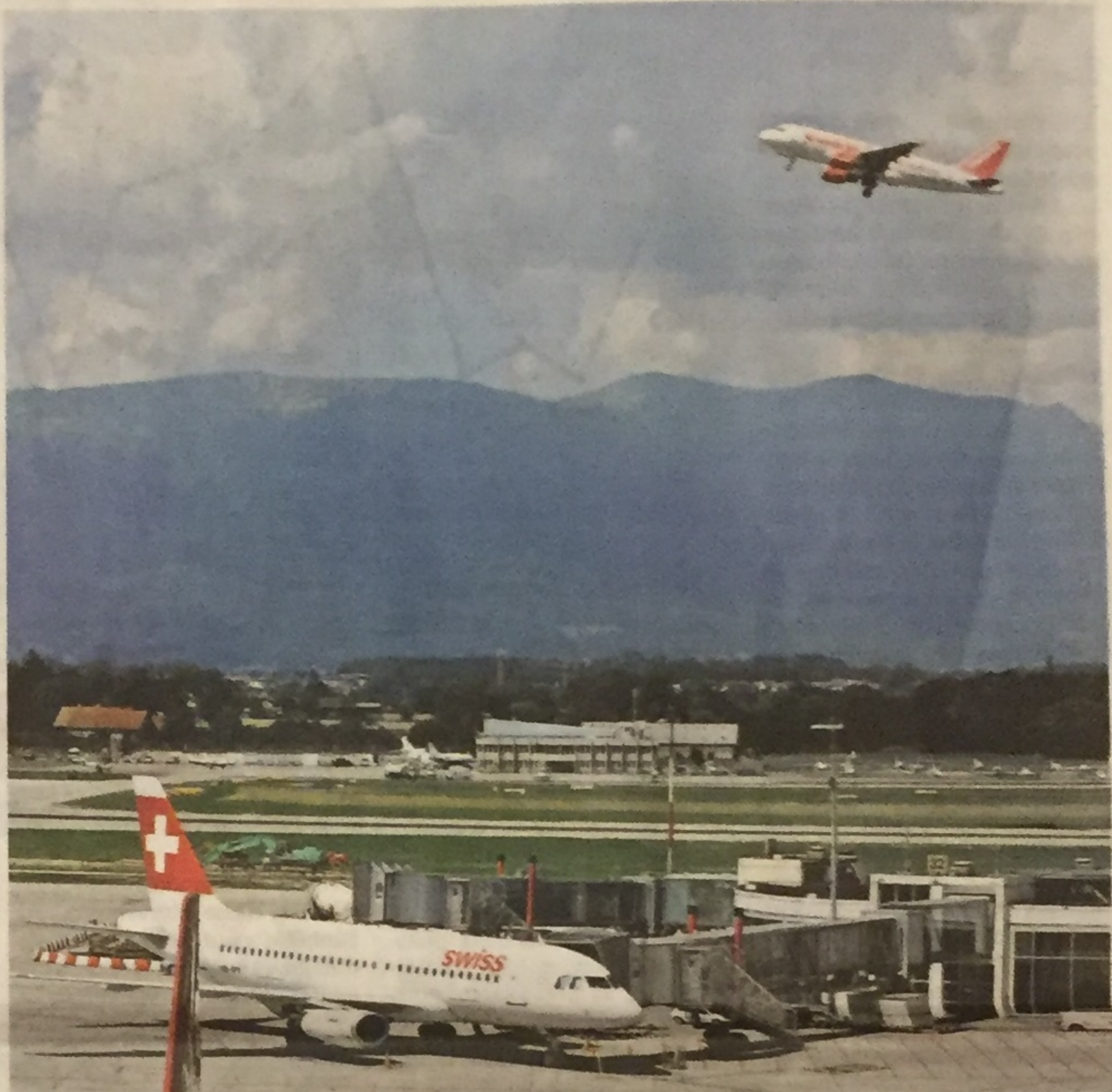
Les localités riveraines demandent que le volume sonore soit plafonné de 20 h à 7 h du matin. Par ailleurs, seuls les avions les plus silencieux pourraient voler durant cette plage nocturne. LAURENT GUIRAUD